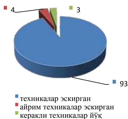
1-расм. “ММТПда мавжуд техникалар ҳолати қандай?” саволига респондентлар жавоби,