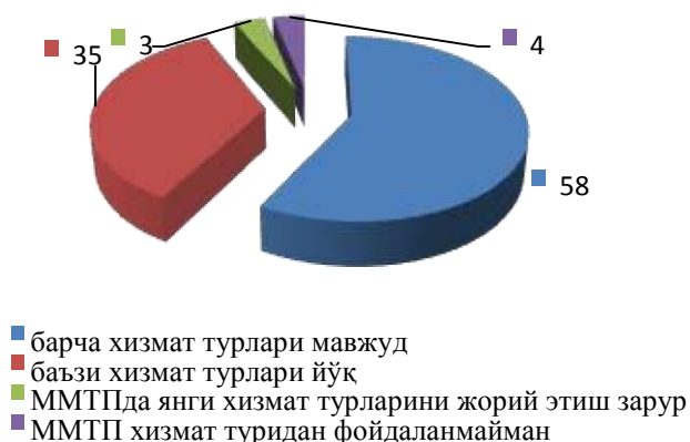
2-расм. “ММТПнинг барча хизмат турлари мавжудми?” бўйича респондентлар жавоби, фоиз фоиз

Хусусан, респондентларнинг 93 фоизи ҳудудларидаги мавжуд ММТПда “техникаларнинг эскирган”лигини қайд этишган, 4 фоиз респондент “айрим техникалар эскирган” деб жавоб берган ва 3 фоизи муқобил МТПда “керакли техникалар йўқ”, деб жавоб беришган. Шунингдек, сўровномада иштирок этган респондентларнинг 35 фоизи муқобил МТПда “баъзи хизмат турлари йўқ”лигини эътироф этишган, 3 фоизи “янги хизмат турларини жорий этиш зарур”, деб ҳисоблайдилар. Респондентларнинг 83 фоизи “ММТПда техникаларни таъмирлаш ва сервис хизмати”, 17 фоизи “чорвачилик тармоғини механизациялаштиришга оид хизмат”ларни ривожлантиришни таклиф этишган.