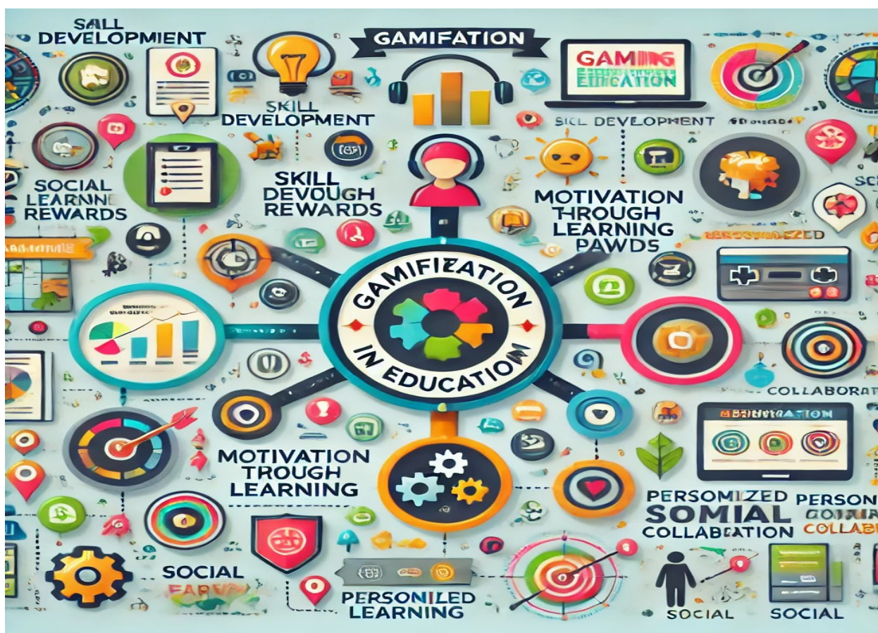
2-rasm. Ta'lim xizmatlarini gamifikatsiyalashning asosiy yo'nalishlari