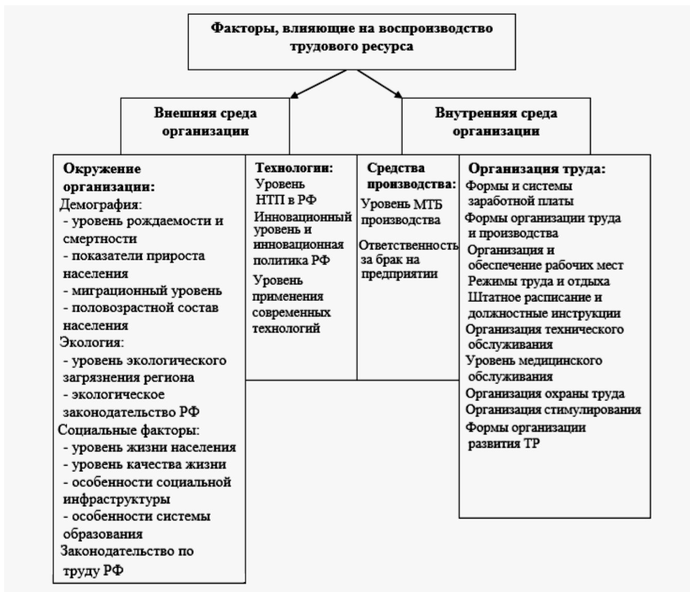
Рисунок 1 - Факторы внешней среды, влияющие на воспроизводство трудовых ресурсов

Среди факторов внешней среды, оказывающих воздействие на формирование системы развития трудовых ресурсов, следует выделить следующие: демографические, экологические, социальные факторы, законодательство по труду.